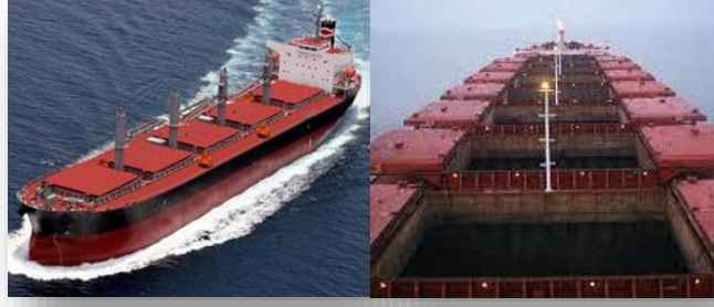
Kuru Yük Gemisi (depolama)