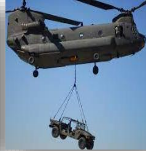
Ağır Yük Helikopteri